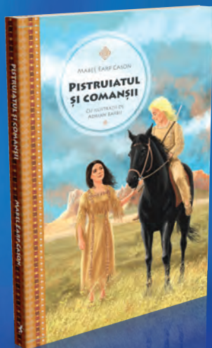
Pistruiatul și comanșii 176 pagini