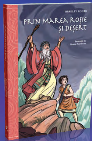
Prin Marea Roșie și deșert 224 pagini