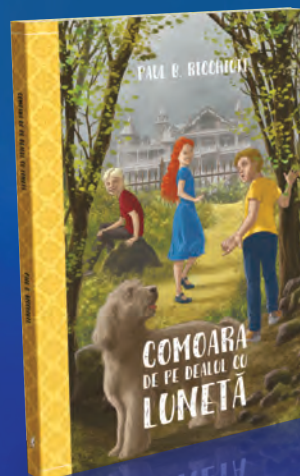
Comoara de pe Dealul cu lunetă 136 pagini