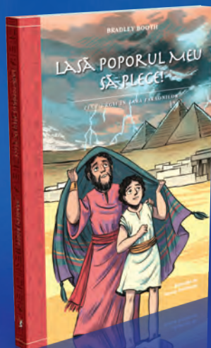
Lasă poporul Meu să plece! 184 pagini