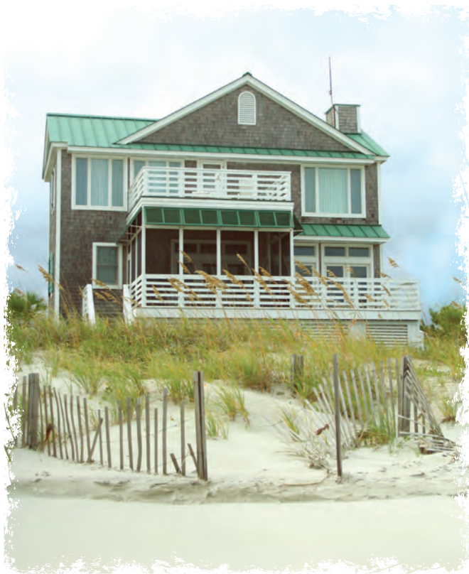
2 Omul nechibzuit și-a zidit casa pe nisip.

Casa omului cu judecată a rămas în siguranță pe stâncă. Și omul a fost în siguranță.