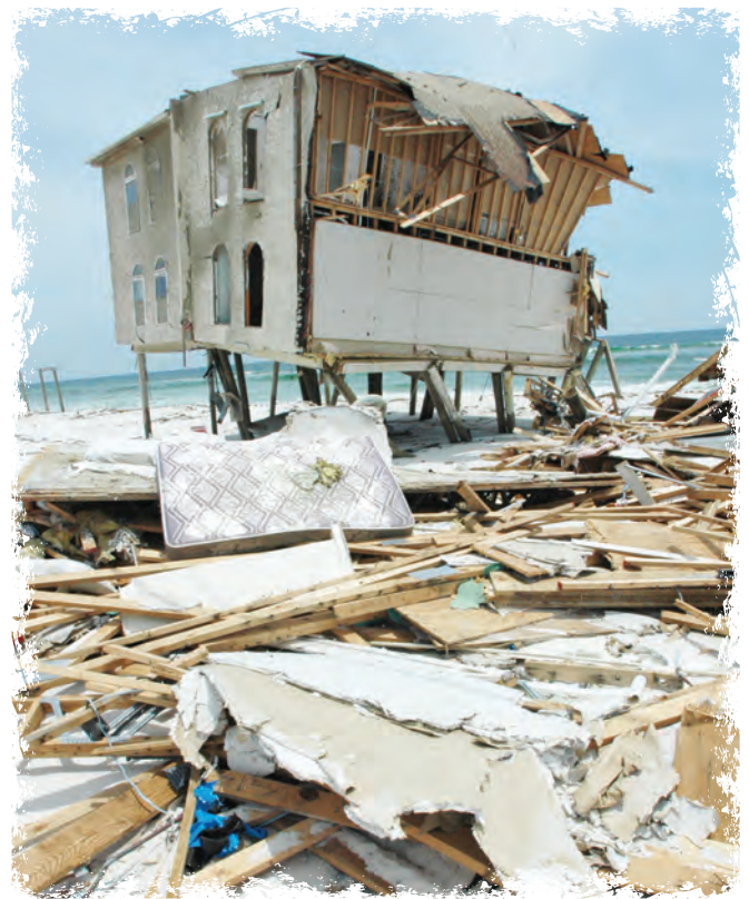
3 Furtuna a distrus casa omului nechibzuit.

Când citim povestirile biblice și ascultăm de poruncile lui Dumnezeu, suntem cu judecată,