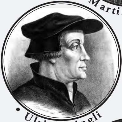
• Ulric Zwingli