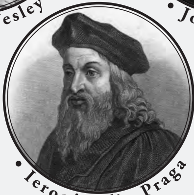
• Ieronim din Praga