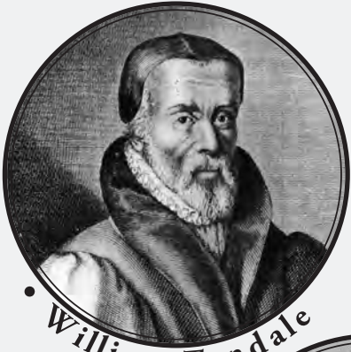
• William Tyndale