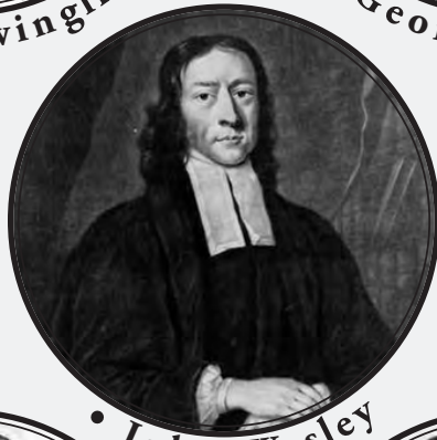
• John Wesley