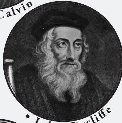
• John Wycliffe