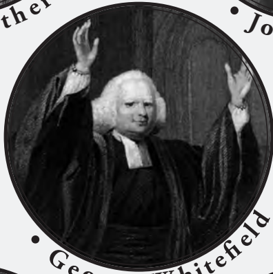
• George Whitefield