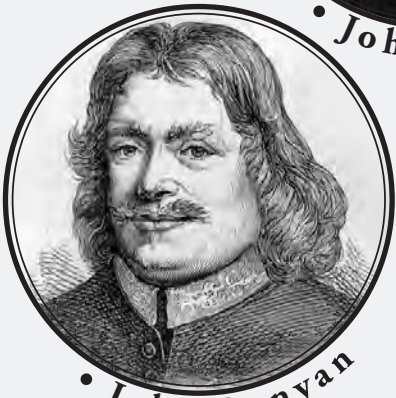
• John Bunyan