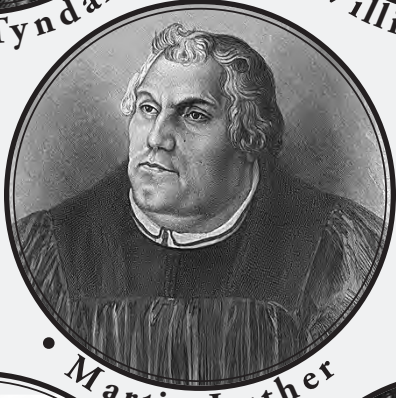
• Martin Luther