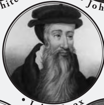
• John Knox