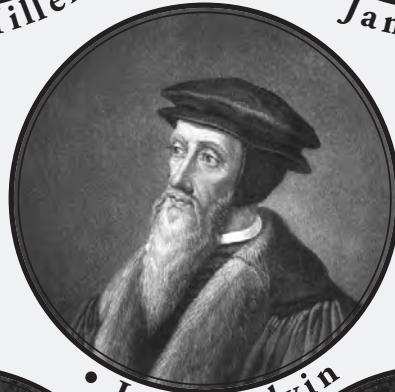
• John Calvin