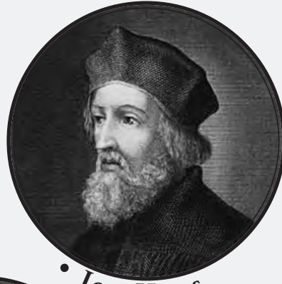
• Jan Huss